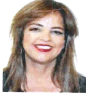
Dip. Lorena Villavicencio Ayala