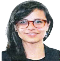
Dip. Ana Lucia Riojas Martínez